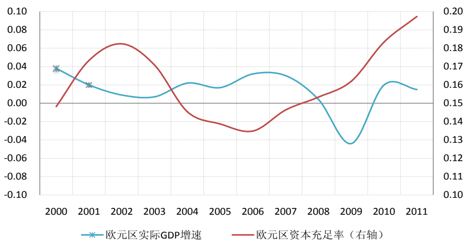
图 2 欧元区银行业经济增速与资本充足率走势